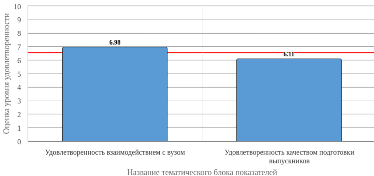
Рисунок 2.1 - Средняя оценка удовлетворенности (по тематическим блокам показателей)

Средняя оценка удовлетворенности респондентов по блоку вопросов «Удовлетворенность взаимодействием с вузом» равна 6.98, что является показателем повышенного уровня удовлетворенности (50-75%).